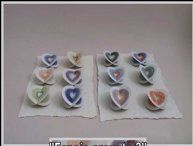
"Espais creuats 3" Eulàlia Oliver