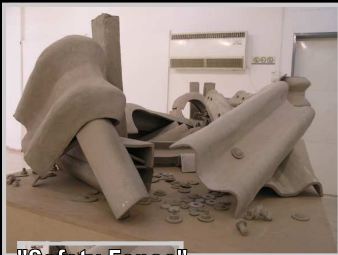
"Safety Fence" Orly Nezer